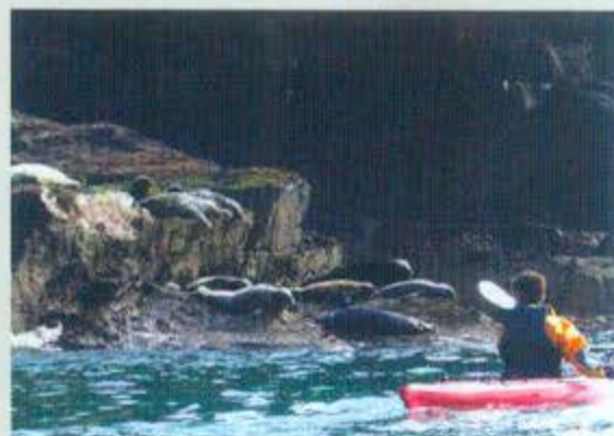
Vi kommer helt tæt på en koloni af gråsæler